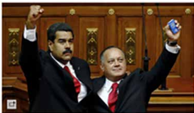
Maduro junto a su 'número dos', Diosdado Cabello en 2013.

Archivado en: Diosdado Cabello · DEA · Venezuela · Lucha antidroga · Narcotráfico · Estados Unidos · Sudamérica · Latinoamérica · Delitos salud pública · Norteamérica · América